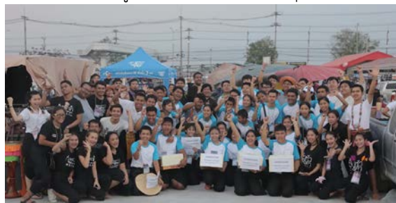
ภาพที่ ๗ ค่ายเพาะกล้าพันธุ์เก่งเพลงพื้นบ้าน ได้รับงบประมาณสนับสนุนจากกระทรวงวัฒนธรรม