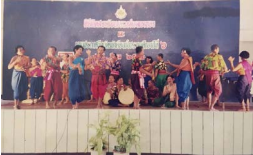
ภาพที่ ๔ เพลงรำไท ตำบลเขาทอง จังหวัดนครสวรรค์

ล่วงมาถึงสมัยรัชกาลที่ ๘ เกิดวิกฤตสงครามโลกครั้งที่ ๒ รัฐบาลของจอมพล ป. พิบูลสงคราม (พ.ศ. ๒๔๘๑ - พ.ศ. ๒๔๘๗) ได้มีนโยบายสร้างชาติเพื่อจัดระเบียบการดำเนินชีวิตของคนไทยให้เป็นแบบอารยประเทศ จึงออกคำสั่งข้อบังคับต่าง ๆ และยังมีมอบให้กรมศิลปากรปรับปรุงทำรำในเพลงรำไทของชาวบ้านให้เป็นทำรำมาตรฐานงดงามตามแบบนาฏศิลป์ไทย เรียกว่า “รำวงมาตรฐาน”