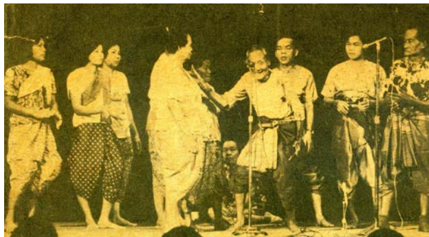
ภาพที่ ๑ ภาพการแสดงเพลงฉ่อยคณะพ่อพรหมแม่ต่วน ที่โรงเรียนสอนภาษาเอยูเอ เมื่อ พ.ศ. ๒๕๑๕

เพลงฉ่อยในสมัยก่อนนั้นมีระเบียบแบบแผนหลายขั้นตอน เริ่มด้วยร้องไหว้ครู บทเกริ่น บทประและเล่นเป็นเรื่องราวต่าง ๆ ปัจจุบันแบ่งออกได้เป็น ๒ ทำนองใหญ่ ๆ คือ ฉ่าเหนือ เล่นกันในจังหวัดนครสวรรค์ อุทัยธานี ชัยนาท ปัจจุบันเหลืออยู่เพียงคณะเดียวคือ คณะโกมินทร์ – ทองใบ ส่วนฉ่ากลางหรือฉ่าใต้ เล่นกันในจังหวัดสุพรรณบุรี อยุธยา ทำนองนี้ยังคงมีผู้เล่นกันหลายคณะร่วมกับเพลงอีแซวและลำตัด