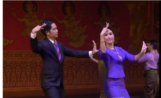
ภาพที่ ๕ เพลงรำวงมาตรฐาน กรมศิลปากร

ในปัจจุบันนี้เพลงพื้นบ้านจำนวนมากน้อยได้สูญหายไปกับพ่อเพลงแม่เพลงที่ล่วงลับไปแล้ว แต่อย่างไรก็ดียังมีหน่วยงานทั้งภาครัฐและเอกชนหลายแห่ง เช่น กระทรวงวัฒนธรรม ศูนย์สังคีตศิลป์ธนาคารกรุงเทพ ศูนย์มานุษยวิทยาสิรินธร ฯลฯ เล็งเห็นความสำคัญของเพลงพื้นบ้าน จัดให้มีการบันทึกเสียงและวีดิโออนุรักษ์การร้องเล่นแบบเก่าเอาไว้ อีกทั้งยังจัดกิจกรรมเชิญศิลปินพื้นบ้านมาถ่ายทอดเพลงพื้นบ้านให้แก่เยาวชนให้สามารถสืบสานและสร้างสรรค์ให้คงอยู่เป็นมรดกทางศิลปวัฒนธรรมของชาติสืบไป