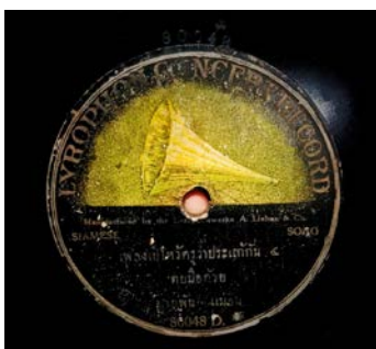
ภาพที่ ๒ แผ่นเสียงเพลงเพลงฉ่อย สมัยรัชกาลที่ ๕

สมัยรัชกาลที่ ๖ การบันทึกเสียงเริ่มแพร่หลายในประเทศไทยมากขึ้นเนื่องจากชาวต่างชาติได้นำวิทยากรนี้เข้ามาตั้งแต่สมัยรัชกาลที่ ๕ จึงได้มีการบันทึกแผ่นเสียง เพลงไทยเดิม เพลงสากล รวมทั้งเพลงพื้นบ้านไว้มากมาย อีกทั้ง โรงพิมพ์โรงพิมพ์ราษฎร์เจริญ วัดเกาะ ได้นำบทเพลงพื้นบ้านออกมาพิมพ์เป็นหนังสือออกจำหน่ายไว้หลายชุด แต่ปัจจุบันยังคงเหลือแผ่นเสียงและต้นฉบับหนังสือที่มีสภาพดีอยู่ไม่มากนัก