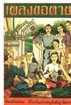
ภาพที่ ๓ หนังสือเพลงขอทาน โรงพิมพ์ราษฎร์เจริญ วัดเกาะ ที่มา : สำนักงานวิทยทรัพยากร จุฬาลงกรณ์มหาวิทยาลัย