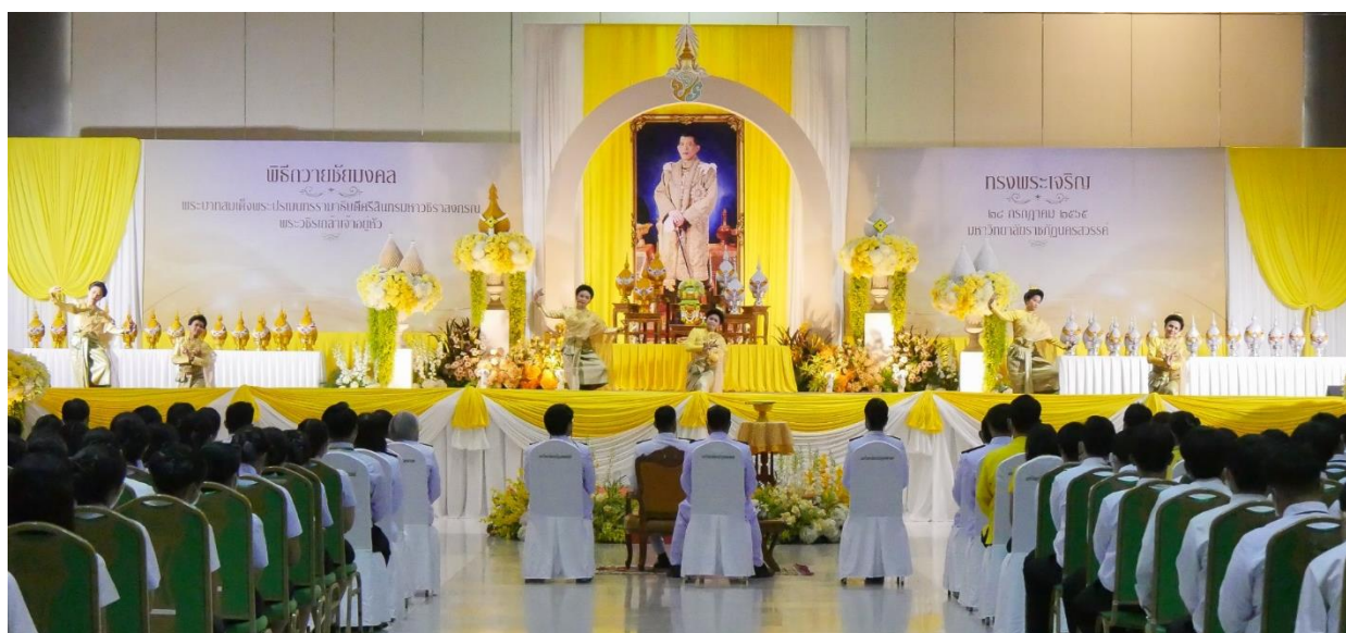
ภาพแสดง การจัดพิธีถวายชัยมงคล เนื่องในโอกาสวันเฉลิมพระชนมพรรษา พระบาทสมเด็จพระเจ้าอยู่หัว เมื่อวันที่ ๒๘ กรกฎาคม ๒๕๖๕ ณ ศูนย์ประชุมและนิทรรศการนานาชาติ มหาวิทยาลัยราชภัฏ นครสวรรค์ ศูนย์การศึกษาย่านมัทรี

จากขั้นตอนในการปฏิบัติงานการเซียมพุ่ม และลักษณะการวางพุ่มในพิธีการสำคัญต่าง ๆ นั้น ผู้เขียนมีความเห็นว่า การเซียมพุ่มและการวางพุ่มนั้น เป็นเพียงองค์ประกอบหนึ่งของงานพิธีการ โดยในพิธีนั้นยังมีส่วนประกอบของรายละเอียดปลีกย่อยในด้านอื่น ๆ ที่มีความละเอียดอ่อนและความพิถีพิถัน ในทุกขั้นตอนอีกหลายรายการ ซึ่งไม่สามารถลงรายละเอียดเชิงลึกไว้ได้ทั้งหมดในบทความนี้ ด้วยเหตุนี้เอง จึงทำให้แต่ละหน่วยงานต่างมีบริบทและรูปแบบกิจกรรมที่แตกต่างกัน อาจเนื่องมาจากหลายปัจจัยทั้งด้านสถานที่ ที่ใช้ประกอบกิจกรรมมีขนาดรูปแบบลักษณะกว้างขวางต่างกัน จึงส่งผลทำให้แต่ละหน่วยงานพยายามสรรหา คัดเลือกวิธีการและขั้นตอน เพื่อกำหนดรูปแบบให้เป็นแนวทางในการนำไปปฏิบัติที่ต่างกันออกไปด้วย ทั้งนี้ ยังคงจำเป็นต้องคำนึงถึงความถูกต้องโดยยึดหลักการปฏิบัติของสำนักพระราชวัง กระทรวง หรือหน่วยงานต้นสังกัดที่ได้กำหนดรูปแบบกิจกรรมขึ้น เพื่อให้เกิดความถูกต้อง เหมาะสม และทำให้พิธีการมีความราบรื่น เรียบร้อย และสวยงามมากที่สุด