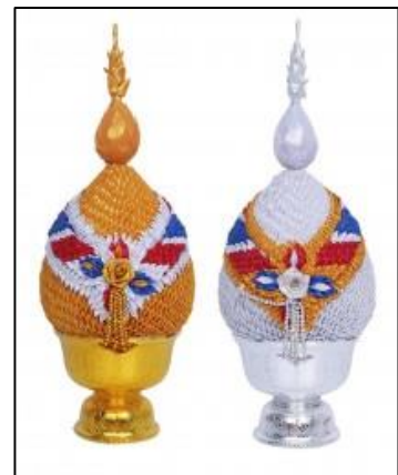
ค) พานพุ่มเงิน-พุ่มทอง