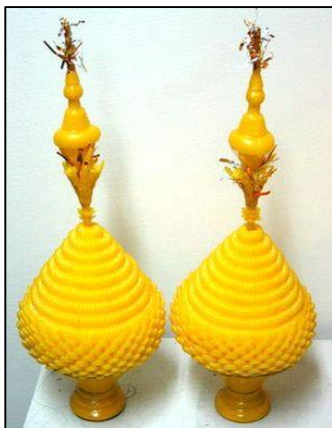
ก) พานพุ่มเทียน

๓. พานพุ่มเงิน-พุ่มทอง คือ การนำผ้าตาดเงินตาดทองมาประดิษฐ์ มีพู่ห้อยระย้า แล้วนำมาจัดตกแต่ง ประกอบกับวัสดุต่าง ๆ เป็นทรงพุ่ม นำมาตั้งไว้บนพาน แล้วนำไปตั้งบูชาหรือนำไปวางเป็นเครื่องสักการะ ซึ่งแล้วแต่กรณี