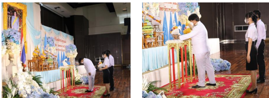
ภาพแสดง ตัวอย่างลักษณะการเซียมและการวางสลัปพานพุ่มเงิน-พุ่มทอง ที่สำนักศิลปะและวัฒนธรรม มหาวิทยาลัยราชภัฏนครสวรรค์ได้นำมาปฏิบัติ

จากขั้นตอนในการปฏิบัติงานการเซียมพุ่ม และลักษณะการวางพุ่มในพิธีการสำคัญต่าง ๆ นั้น ผู้เขียนมีความเห็นว่า การเซียมพุ่มและการวางพุ่มนั้น เป็นเพียงองค์ประกอบหนึ่งของงานพิธีการ โดยในพิธีนั้นยังมีส่วนประกอบของรายละเอียดปลีกย่อยในด้านอื่น ๆ ที่มีความละเอียดอ่อนและความพิถีพิถัน ในทุกขั้นตอนอีกหลายรายการ ซึ่งไม่สามารถลงรายละเอียดเชิงลึกไว้ได้ทั้งหมดในบทความนี้ ด้วยเหตุนี้เอง จึงทำให้แต่ละหน่วยงานต่างมีบริบทและรูปแบบกิจกรรมที่แตกต่างกัน อาจเนื่องมาจากหลายปัจจัยทั้งด้านสถานที่ ที่ใช้ประกอบกิจกรรมมีขนาดรูปแบบลักษณะกว้างขวางต่างกัน จึงส่งผลทำให้แต่ละหน่วยงานพยายามสรรหา คัดเลือกวิธีการและขั้นตอน เพื่อกำหนดรูปแบบให้เป็นแนวทางในการนำไปปฏิบัติที่ต่างกันออกไปด้วย ทั้งนี้ ยังคงจำเป็นต้องคำนึงถึงความถูกต้องโดยยึดหลักการปฏิบัติของสำนักพระราชวัง กระทรวง หรือหน่วยงานต้นสังกัดที่ได้กำหนดรูปแบบกิจกรรมขึ้น เพื่อให้เกิดความถูกต้อง เหมาะสม และทำให้พิธีการมีความราบรื่น เรียบร้อย และสวยงามมากที่สุด