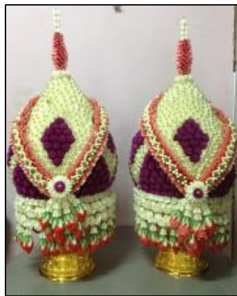
ข) พานพุ่มดอกไม้