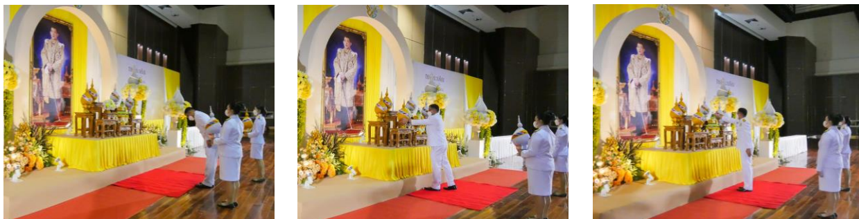
ภาพแสดง ตัวอย่างลักษณะการเชิญและการวางพานพุ่มเงิน-พุ่มทอง ที่สำนักศิลปะและวัฒนธรรม มหาวิทยาลัยราชภัฏนครสวรรค์ได้นำมาปฏิบัติ